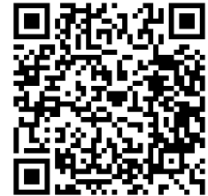
受講申込み用QRコード

(2) 申込締切：11月28日（木）とします。申込みの先着順に受け付けをします。